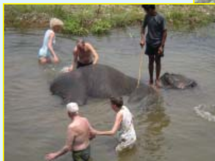
En massa badande elefanter!