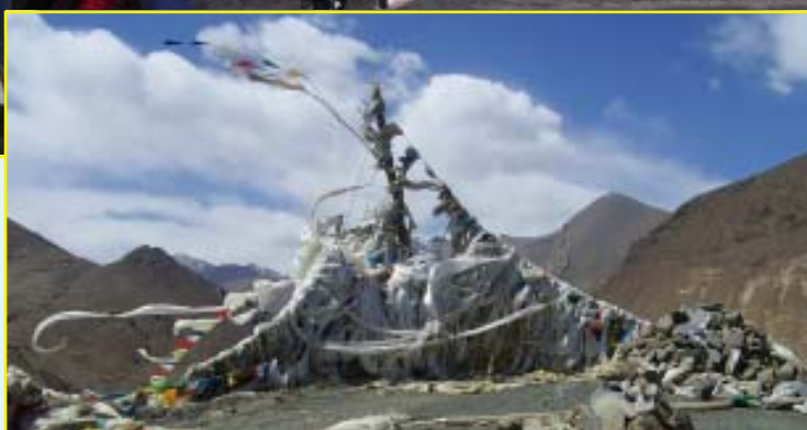
Passet var välförsett med Katas.

Spänningen ökade i takt med att landskapet förändrades. Våra Land Cruiser arbetade sig fram på den oftast knaggliga grusvägen. Höjderna närmade sig och vi stannade till på de högsta nivåerna. Normalt är ju 4-4500 meter en respektingivande höjd men här talade man bara om passen som var över 5000 meter. Första "riktiga" passet var på 5050 meters höjd, men högre skulle det bli. Dagarna var behagliga trots en frisk vind, ibland häftig!