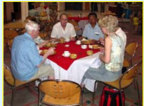
Hotellfrukost i Delhi

Snabb transport till vårt hotell blev det eftersom vi anlände till Delhi sent på kvällen. Sightseeing i Delhi påföljande dag. En hel del platser besöktes men det blev lite "kaka på kaka" med alla Fort. Vår