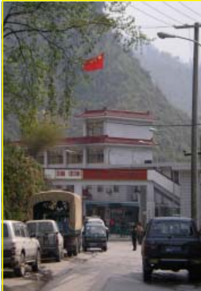
Kinesiska flaggan vajar vid gränsstationen.

Ny väntan, nu betydligt längre tid. Vår privata transport tog oss tillbaka till Tibet Guest House i Kathmandu.