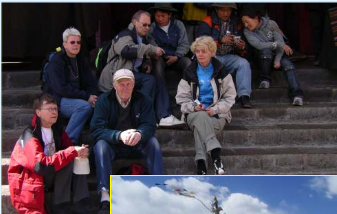
Gänget samlat på en klostertrappa!

Tashilhunpo-klostret, grundat 1447 av Ganden Drup, den första Dalai Laman. Numera säte för Tibets näst högste religiösa ledare Penchen Lama (utsedd av kineserna). Inne i temlet finns en 26 meter hög Buddhastaty, klädd med 300 kg guld!